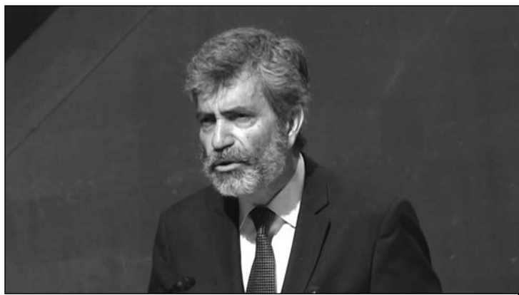
Carlos Lesmes, presidente del Consejo General del Poder Judicial.

En junio del año 2017 comenzaron a funcionar los juzgados especializados en cláusulas abusivas, como una medida que intentaba solucionar el colapso de la Justicia debido al aluvión de demandas por cláusula suelo, hipoteca multidivisa o gastos de formalización. En su primer año de vida han recibido más de 247.000 reclamaciones, de las que aún les quedan por resolver la mayoría. Según datos del Consejo General del Poder Judicial, desde entonces, estos 54 juzgados han dictado más de 23.000