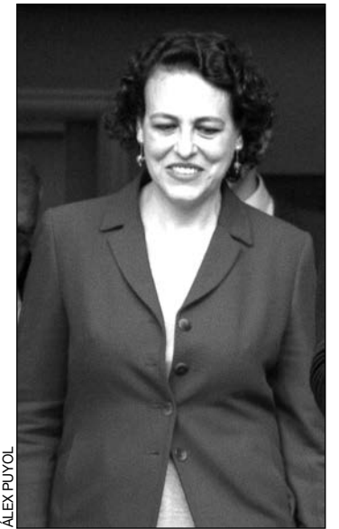
M. Valerio, ministra de Trabajo.

“Si debemos sacar algo del Fondo, tendremos que sacarlo, porque los pensionistas tienen derecho a cobrar sus pagas extraordinarias”, dice Magdalena Valerio, ministra de Trabajo ante la posibilidad de tener que tocar la ‘hucha’ para pagar las pensiones y añade que: “A mí me encantaría no tener que tocar el Fondo de Reserva, pero quiero ser prudente. Vamos a ver cómo va evolucionando la recaudación de cuotas de aquí a final de año”. La ministra reconoce que podría ser necesario para pagar la extra de Navidad porque el desequilibrio presupuestario del sistema hace insuficiente el crédito que el Tesoro Público concedió a la Seguridad Social para hacer frente a una nómina mensual que supera ya los 9.000 millones de euros.