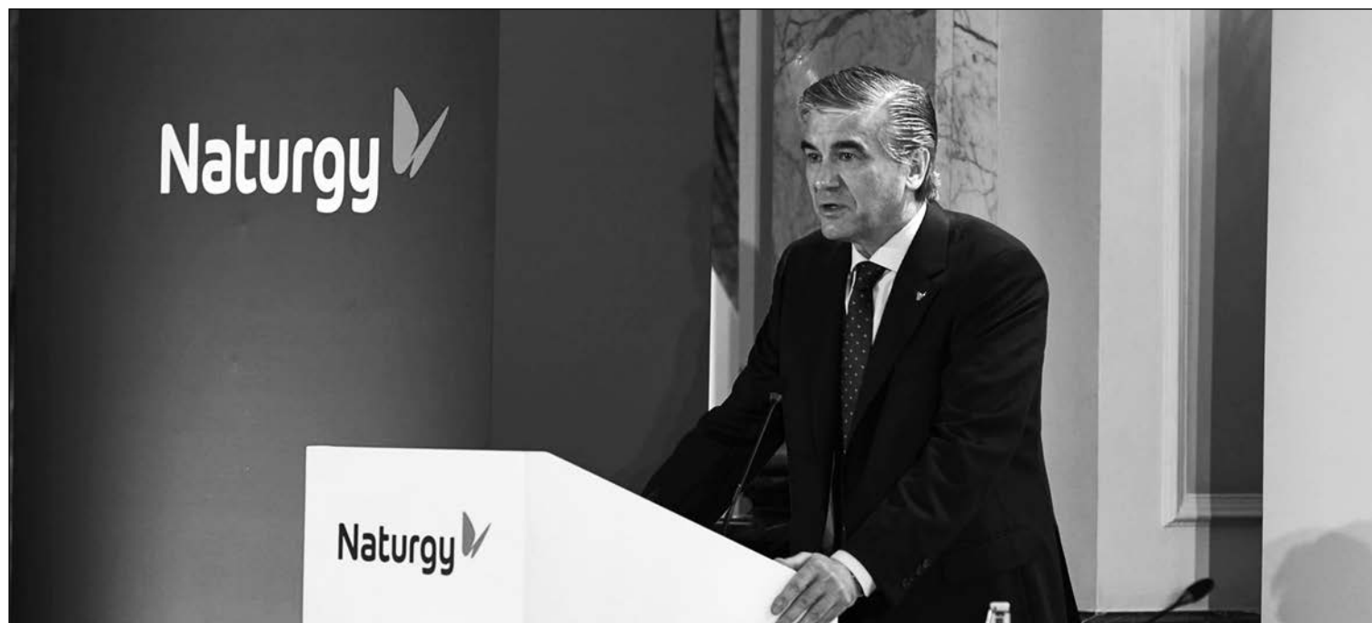
Francisco Reynés, presidente Naturgy.

La compañía que preside Francisco Reynés ha apostado por reinventarse e inicia una nueva era como empresa energética global y con el foco puesto en las energías limpias. Alcista mientras no pierda el soporte de los 22 euros generado en la jornada del 2 de julio, según los expertos, y con el foco puesto en la retribución al accio-