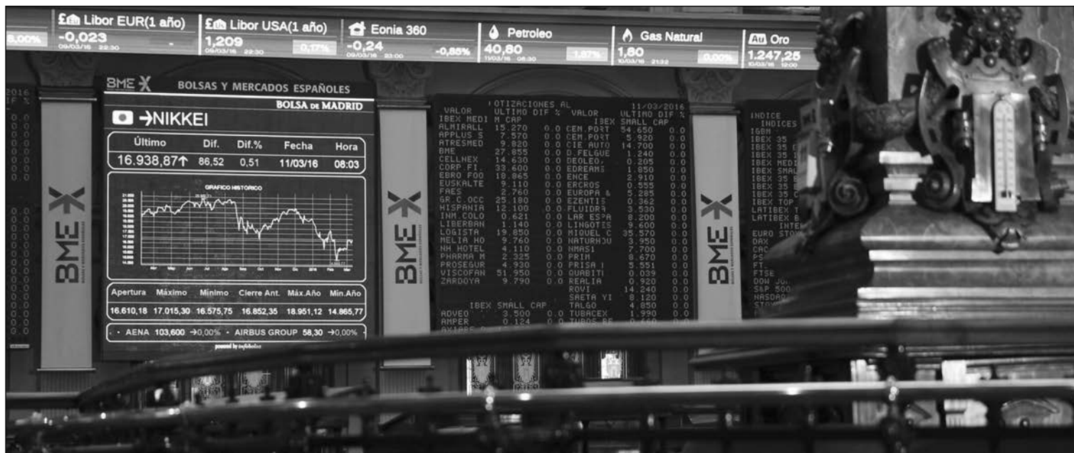
Bolsa de Madrid.

La mayoría de bancos europeos han sido reestructurados, saneados y cuentan con unos niveles de capital suficientes. Por lo tanto, "el sector está en una situación más favorable para mejorar la rentabilidad del capital al accionista y financiar el crecimiento orgánico adicional o el crecimiento externo", según los expertos. Desde mediados de 2016 el sector bancario europeo