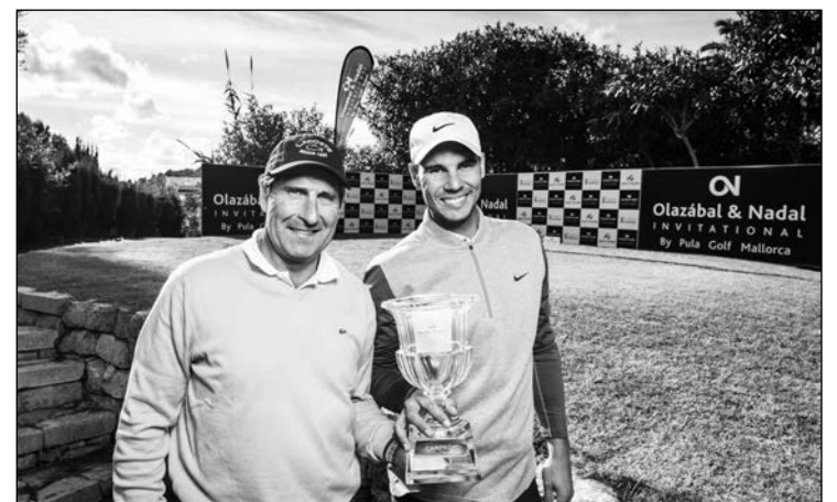
Rafa Nadal y Chema Olazábal, protagonistas solidarios a través del deporte.

En las cuatro ediciones anteriores, se recaudaron un total de 500.000 euros, que fueron destinados a proyectos sociales, como el llevado a cabo en el Centro de la Fundación Rafa Nadal, en Palma de Mallorca, donde se desarrolla un proyecto educativo complementario a la formación escolar dirigido a menores que viven en situaciones