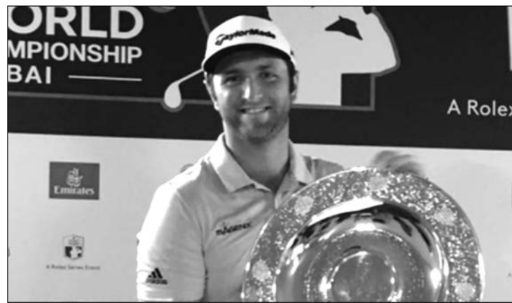
Jon Rahm, mejor rookie del año de 2017.