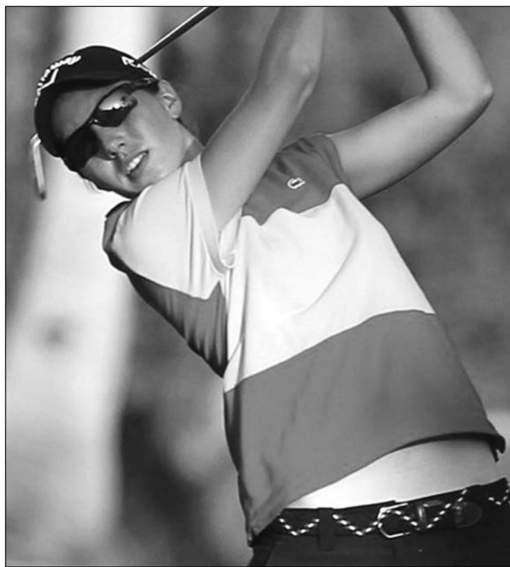
Carlota Ciganda rozó la victoria en la India.

■ Carlota Ciganda ha peleado este fin de semana por la victoria, la que hubiese sido la tercera en el Circuito Europeo Femenino, en el Hero Women's Indian Open, que ha involucrado a un buen número de españolas. No ha podido obtener el título, pero su tercera plaza final con -8 premia su gran semana. La golfista navarra luchó por el triunfo hasta los hoyos finales. Tanto es así que a falta de tres hoyos para el final de su ronda final marchaba a un solo golpe de la cabeza, pero un bogey inoportuno al 15, unido a aciertos de sus rivales, prácticamente sepultó sus opciones. Su comienzo de ronda fue espectacular, con dos birdies y un eagle por los primeros nueve hoyos. Luna Sobrón, decimotercera con -4, Marta Sanz, decimonovena con -3, y Belén Mozo, vigesimoquinta con -1, también han hallado puestos de Top 30.