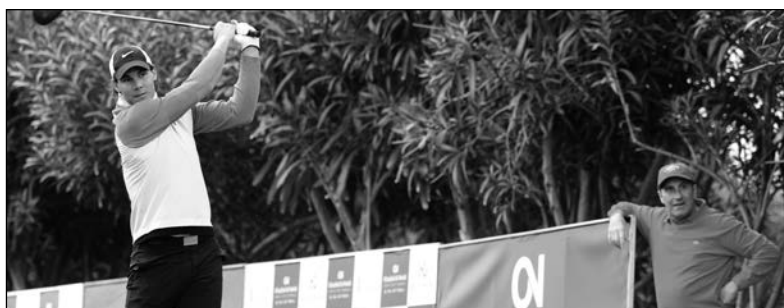
Rafa Nadal y José María Olazábal, dos estrellas del deporte muy solidarias.

E l tenista número 1 del mundo, Rafa Nadal, y el mítico golfista José María Olazábal volverán a unirse los próximos 24 y 25 de noviembre en Son Servera (Mallorca) para disputar el torneo de golf benéfico Olazabal&Nadal Invitational by Pula Golf Resort. En el evento, que este año llega a su quinta edición, se reunirán tanto golfistas profesionales, como amateurs de todo el mundo, con un único objetivo: recaudar fondos a favor de los colectivos más desfavorecidos. PIII