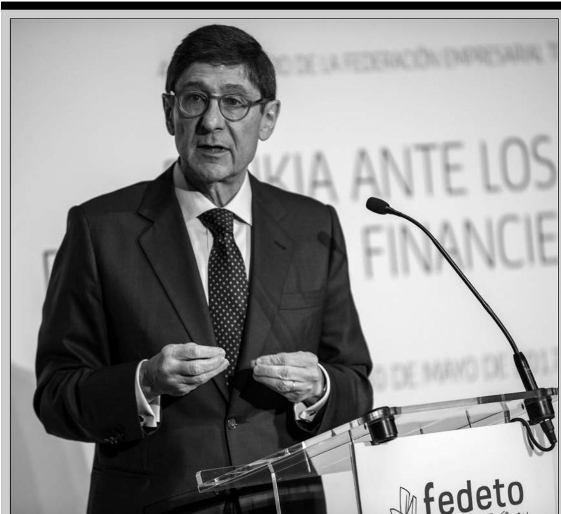
José Ignacio Goirigolzarri, presidente de Bankia.

oposición, la patronal y los sindicatos, es la suma de las siguientes cantidades: por un lado, 850 millones de euros, para hacer la subida propiamente. Y, además, otros 450 millones de euros, para lo que se conoce, técnicamente, como los complementos de mínimos. Parece que la titular de Empleo quiere hacer un guiño a la oposición, de cara a desatascar las conversaciones del Pacto de Toledo, y cumplir con el compromiso ya contenido en la reforma del Pacto de Toledo y en la propia ley de reforma de la Seguridad Social, que tuvo lugar en 2011. Hasta ahora no ha sido posible por la crisis económica.