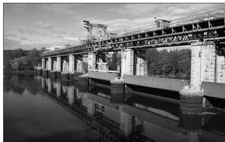
Central minihidráulica de Iberdrola en La Rioja.

Las centrales minihidráulicas, muchas de ellas centenarias, están sufriendo como ninguna las graves consecuencias de la sequía que azota a nuestro país. Lo que agrava su situación y las deja en peor situación que a otras es que a ellas, además, les recortaron las primas en 2013 y más del 70% no tiene retribución pero si impuestos específicos. Y, además, para redondear el círculo vicioso en el que se encuentran, la regulación establece penalizaciones por baja producción, algo que constituye una doble injusticia