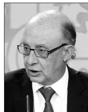
Cristóbal Montoro y la vicepresidenta Sáenz de Santamaría.