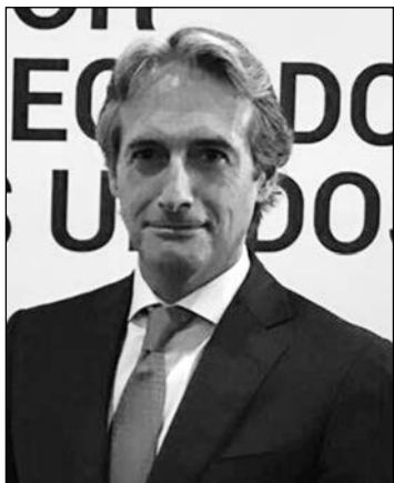
I. de la Serna.

De perlas le vino al ministro de Fomento, Iñigo de la Serna, que la pasada semana, justo después del 1-O, las movilizaciones en la calle, los discursos solemnes de unos y otros, le cayera en las manos un acto de corte empresarial. Un acto donde lo que se pierde y se gana en las discusiones territoriales se ve más claramente. Cristalino, dirían algunos. Como el acto que en Madrid reunió a empresarios de toda España para reivindicar el Corredor Mediterráneo, la infraestructura que conecta el eje entre Algeciras y la frontera francesa y que está ejecutada en un 63%. Ahí todos de acuerdo, desde Andalucía a Cataluña, pasando por Valencia. Como no podía ser de otra manera el acto