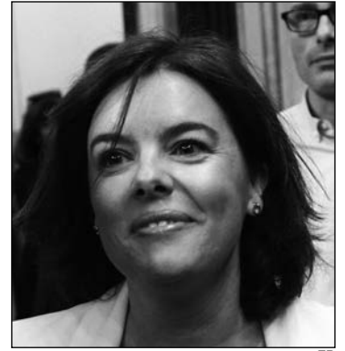
S. Sáenz de Santamaría.

"El agotamiento de la legislatura dependerá de la habilidad del presidente para romper el frente de izquierdas que todavía doblará el brazo del Gobierno modificando leyes y ganando votaciones"