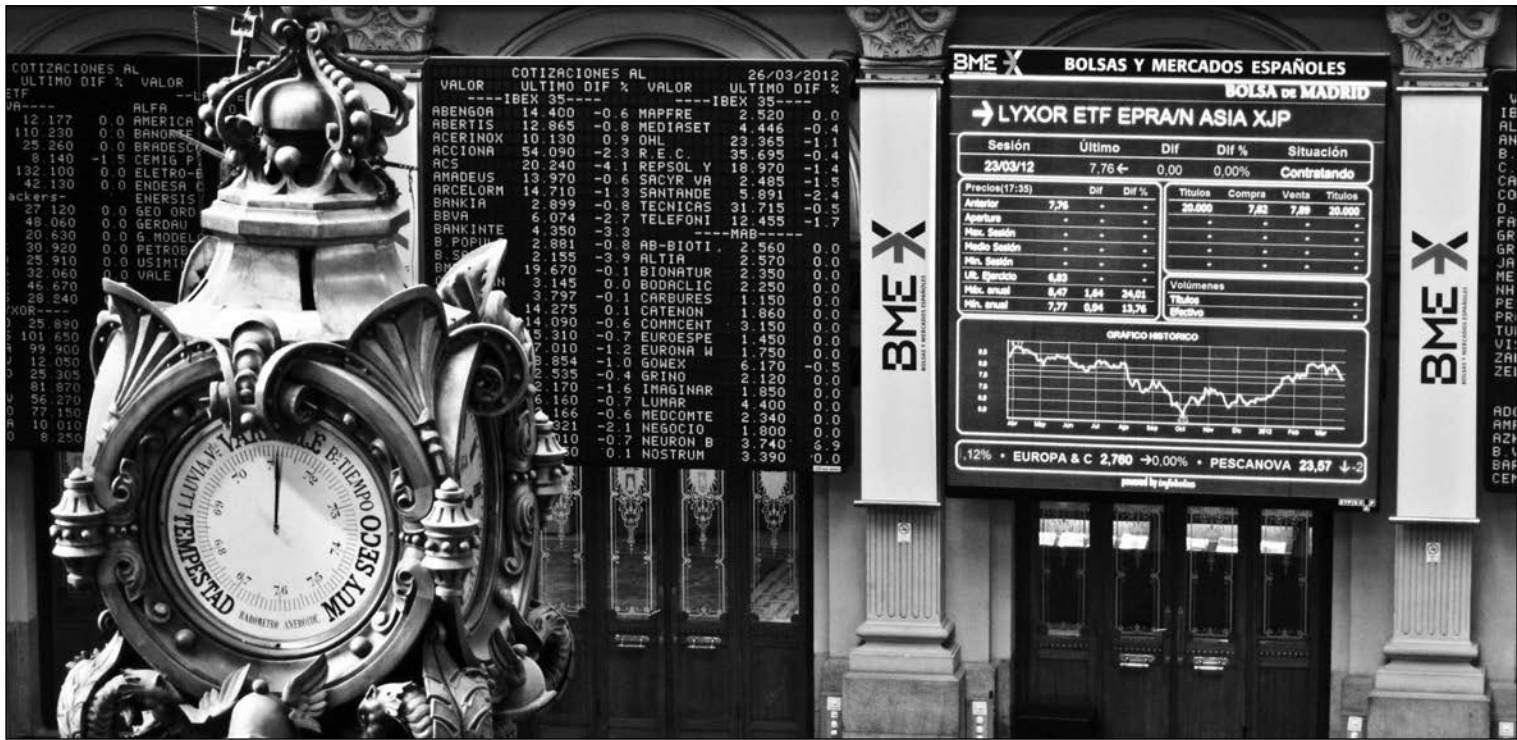
Bolsa de Madrid.

Las empresas que conforman el Ibx-35 obtuvieron un beneficio neto de 10.458,95 millones de euros en el primer trimestre del año, lo que supone un aumento del 29,49% respecto al mismo periodo del ejercicio anterior. El aumento en la facturación y el buen comportamiento de determinados