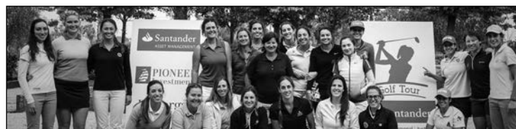
Las profesionales españolas contarán un año más con el Santander Tour femenino.