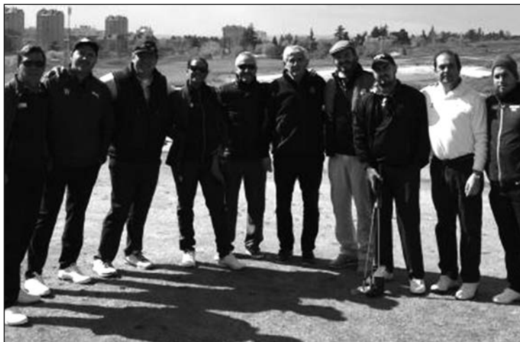
El equipo cubano de golf, en las instalaciones del CNG de Madrid.

■ El equipo cubano de golf ha realizado una histórica visita a España con motivo de su próxima participación en el Campeonato del Mundo de Pitch & Putt, el primer torneo de carácter internacional de la historia que cuenta con presencia de un combinado de este país caribeño. Los integrantes del equipo cubano visitaron diversas instalaciones de pitch & putt de la capital de España, donde tuvieron la oportunidad de entrenar de cara al inminente compromiso mundial, que tendrá lugar en el recorrido italiano de Le Robinie del 31 de marzo al 2 de abril. Golf Negralejo –único campo de pitch & putt de la Comunidad de Madrid que cuenta con 18 hoyos–, el Nuevo Club de Golf de Madrid, en Las Matas, y la Escuela de Golf de la Federación de Madrid –donde fueron recibidos por su presidente, Ignacio Guerras– formaron parte del programa de visitas que incluyó también las instalaciones del Centro Nacional y del Centro de Excelencia, a la vanguardia de los centros de formación y entrenamiento del continente europeo, momento en el que asimismo fueron recibidos por el presidente de la RFEG, Gonzaga Escauriaza.