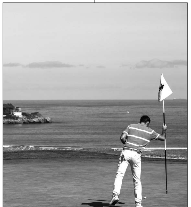
El hoyo 14 del RCG de Pedreña, uno de los hoyos donde también se vivirá intensamente el Desafío Severiano Ballesteros.