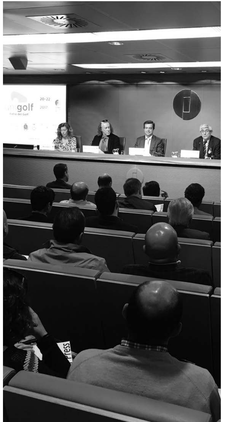
Ifema presentó en Madrid Unigolf, que se celebrará del 20 al 22 de abril.

Tanto el viernes como el sábado, 21 y 22 de abril, las puertas se abrirán para el público en general, con entrada gratuita para federados, para lo que se han programado distintas actividades.