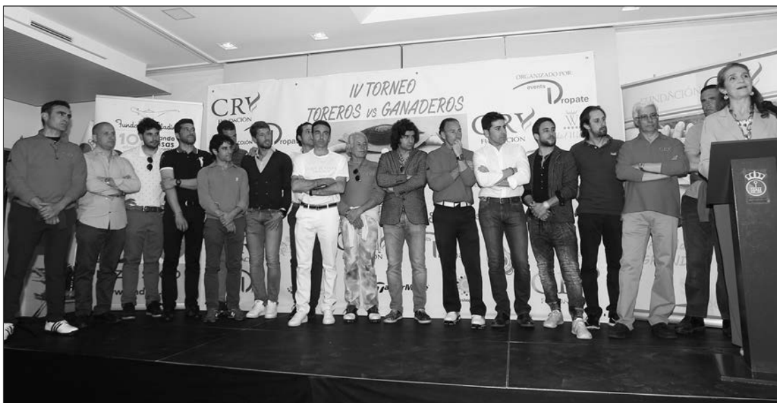
La infanta Elena presidió la entrega de premios.