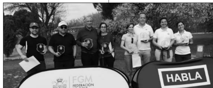
Los ganadores de esta singular iniciativa posando con sus trofeos.

La modalidad de P&P está dirigida a toda clase de jugadores federados, sin límite de edad, ni categoría, sin distinción de sexo, pertinencia o no a un club de golf y como modo de iniciación en la práctica del golf, de una forma lógica y ordenada. De ahí su éxito jornada tras jornada.