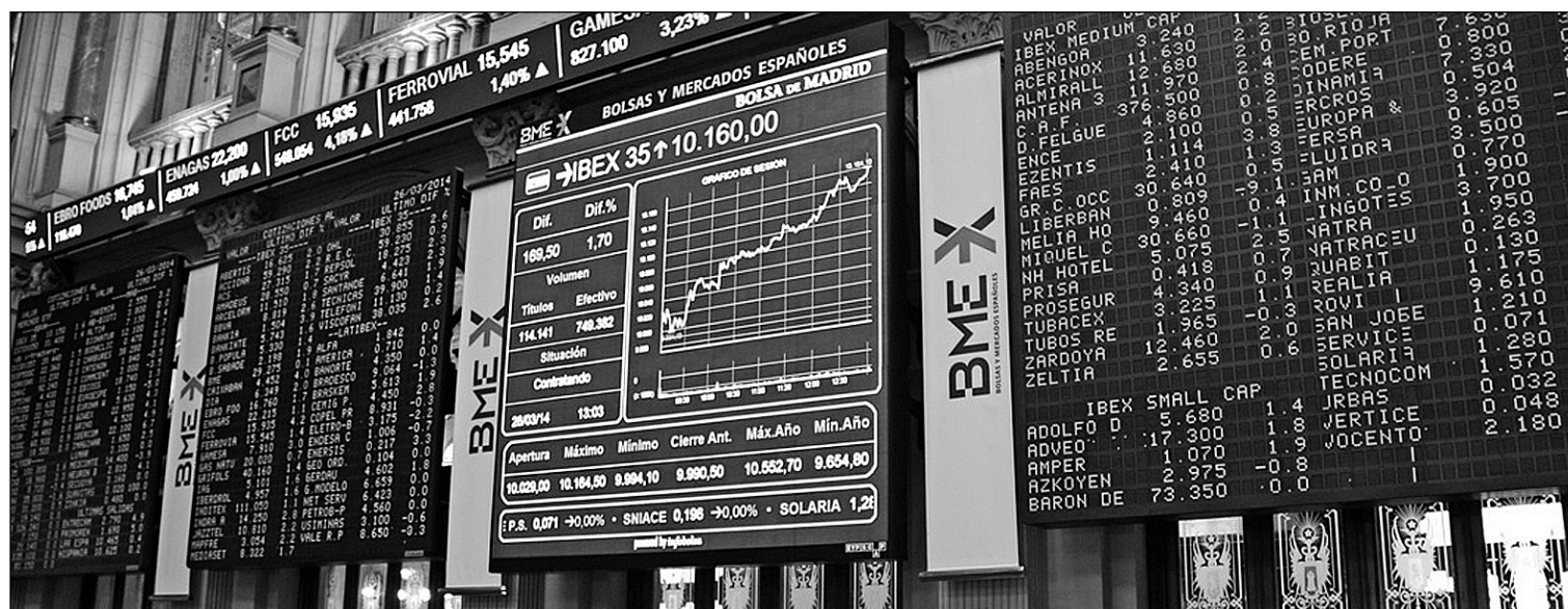
Bolsa de Madrid.

La entrada de Goldman Sachs en Tecnocom con la compra del 1,68%, el desembarco de Renaissance Technologies en Amper con una participación superior al 3% o el paquete del 5% afluado por el fondo estadounidense Briarwood Capital en la inmobiliaria Renta Corporación muestran el movimiento que se está produciendo en algu-