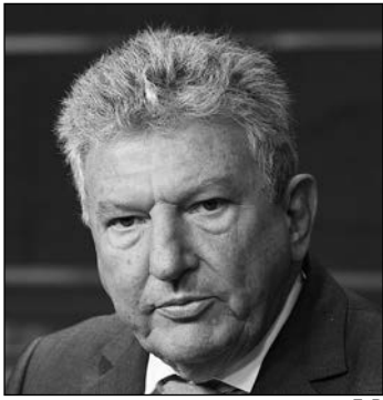
P. Quevedo. E.P.