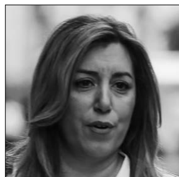
S. Díaz.

2017. Pero, hete aquí que Rajoy ha enviado a la bancada socialista, y en menor medida también a Albert Rivera , la advertencia de que tan malo es no tener Gobierno como no poder gobernar. En otras palabras, que o le dejan aprobar las leyes que considera necesarias para consolidar, sobre todo, la recuperación económica, o estará plenamente legitimado para convocar otras elecciones, una