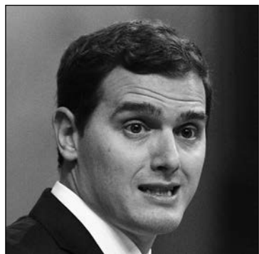
A. Rivera. E. P.

el mango para poder decir a sus electores: queridos españoles, hasta aquí hemos llegado, no podemos sacar adelante las reformas que están en nuestro programa, no comulgamos con las que defiende el resto del arco parlamentario y, por tanto, lo lógico es que ustedes vuelvan a decidir.