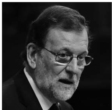
M. Rajoy.

El PNV no es el único que le va a poner difícil al líder del PP la XII legislatura. El portavoz socialista, Antonio Hernando , ha hecho descansar la decisión de abstenerse en las ventajas que ello le va a reportar al PSOE como el partido más influyente en todas las políticas que pueden ser rentables para su electorado. Hernando se ha esforzado en anticipar que su grupo se volcará en una oposición contundente y que ni siquiera pondrá fácil al nuevo Gobierno la aprobación de los Presupuestos estatales para