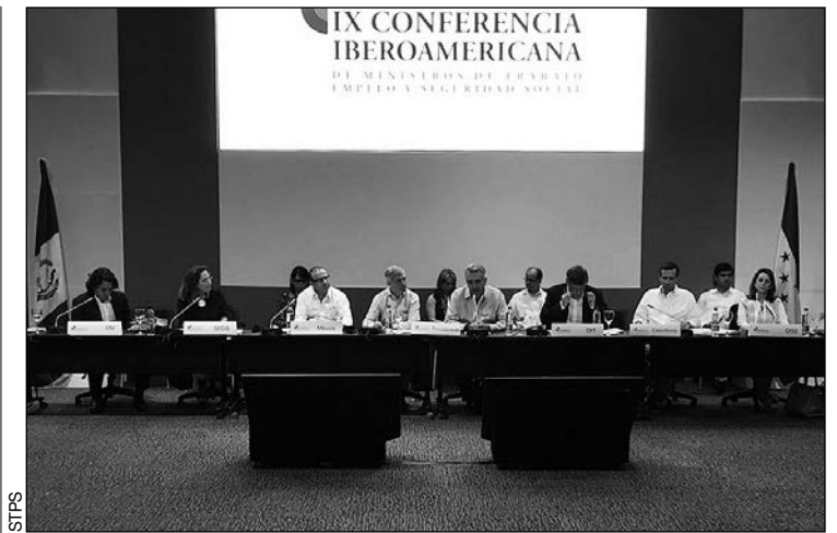
Representantes de 22 países participaron en la IX Conferencia Iberoamericana de ministros de Trabajo, Empleo y Seguridad Social.

Sin embargo, el ajuste del déficit en cuenta corriente de Turquía desde el año 2001 ha sido importante y la última cifra anual muestra que la mayor parte del componente cíclico del déficit ha sido corregida. El mensaje clave de estas medidas es que el saldo de la cuenta corriente estructural de Turquía estaba cerca de un 4,5% a finales de 2015, según el modelo de BBVA Research. Por lo tanto, casi todo el déficit de la cuenta corriente a finales de 2015 era estructural y el grueso del ajuste ha venido de la parte cíclica. Además, y dado que se espera que la recuperación de la demanda inter-