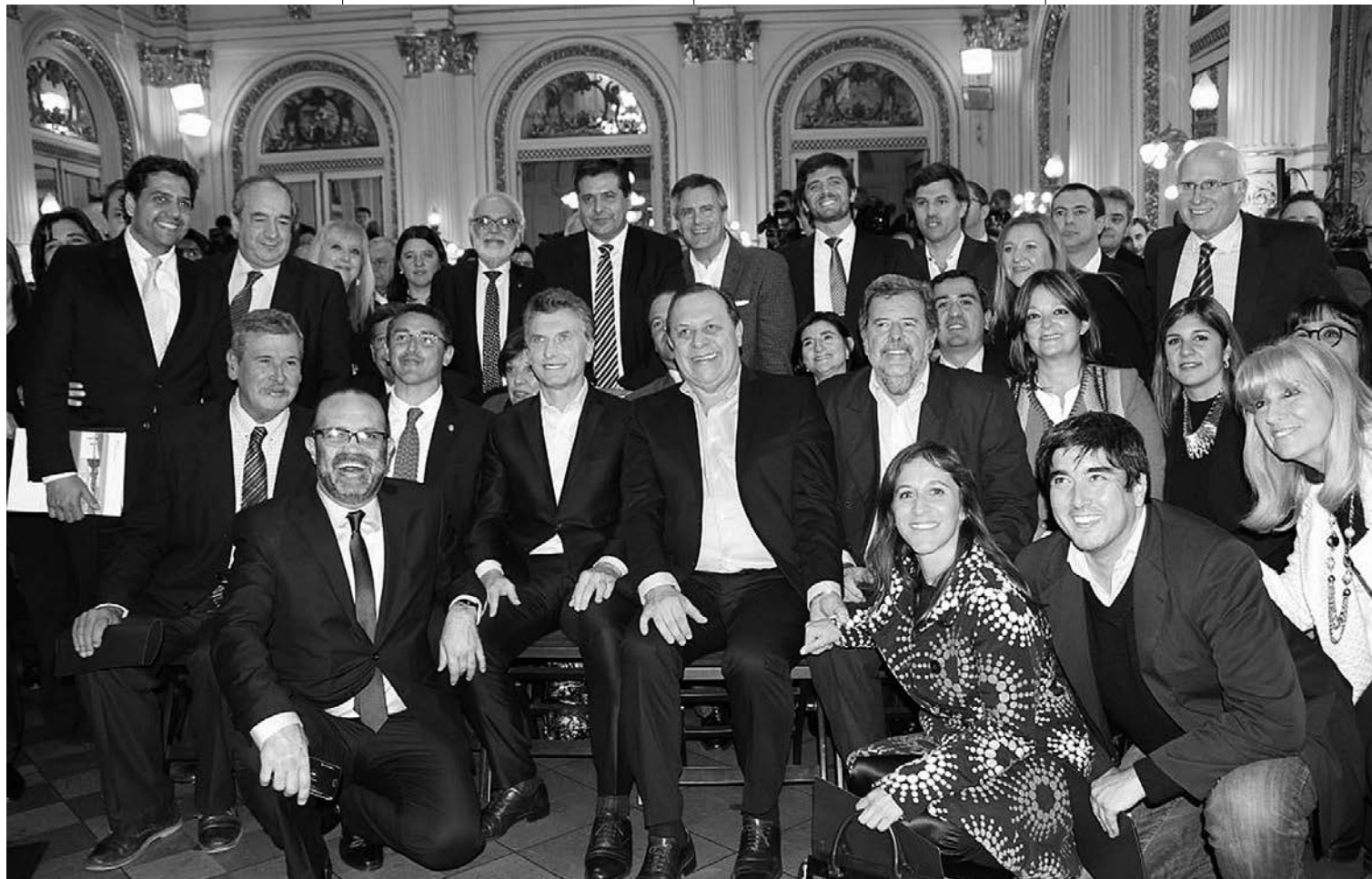
El presidente Macri y el ministro de Turismo, Gustavo Santos, encabezaron un acto en el que el sector turístico nacional se comprometió a trabajar desde una perspectiva federal.

Mauricio Macri presentaba hace unas semanas el nuevo Plan Nacional de Turismo de Argentina. Con el principal objetivo de posicionar al país como líder turístico en América del Sur, pretende generar 300.000 nuevos puestos de trabajo y aumentar un 50% la llegada de turistas internacionales, lo que podría suponer un ingreso cerca-