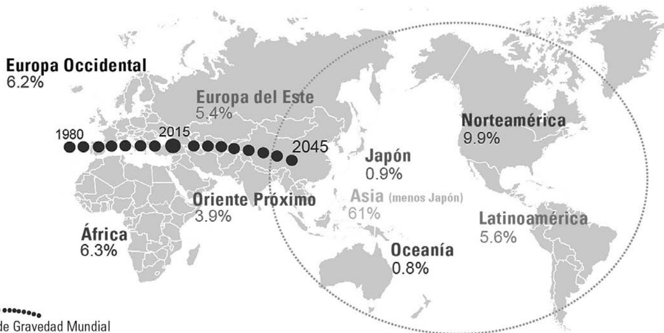
Centro de Gravedad Mundial