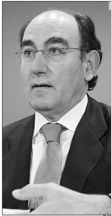
Ignacio Galán, presidente de Iberdrola.