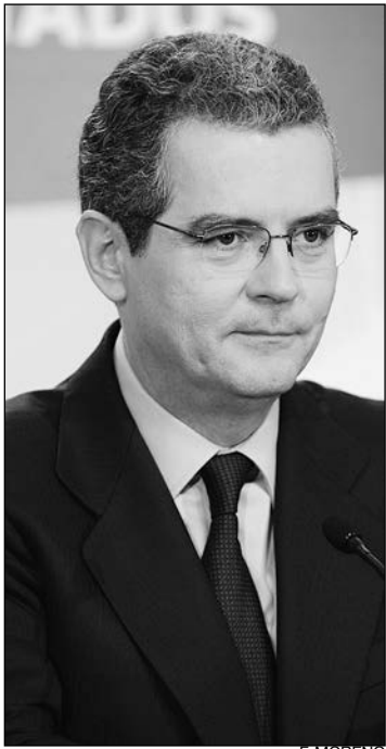
Pablo Isla, presidente de Inditex.