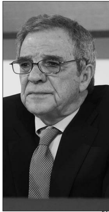
César Alierta, ex presidente de Telefónica.

Salvo contadas excepciones, el Ibex se ha subido el sueldo en 2015. Ya sea por el cobro de bonus de objetivos, planes de acciones o aportaciones al plan de pensiones, lo cierto es que los presidentes de las principales empresas españolas han visto cómo sus retribuciones se veían incrementadas hasta sumar, en el caso