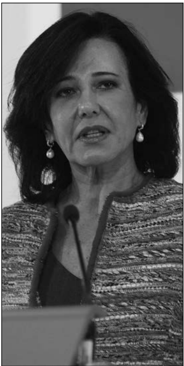
Ana Botín, presidenta del Santander.