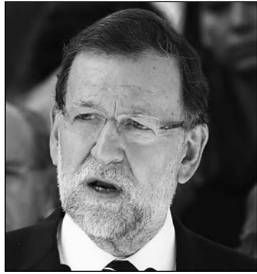
M. Rajoy.

Son muchas las cáscaras de plátano que el PSOE, Ciudadanos y algunos medios de comunicación están poniendo delante de Rajoy y también es conocido el oficio del presidente del Gobierno para esquivar los resbalones. No todos los ministros le ayudan a ello, es verdad. La reflexión en alto del ministro José Manuel García-Margallo sobre la posibilidad de que las tropas españolas releven a las francesas en Mali para que el Ejército galo centre toda su fuerza en Siria, ha caído en La Moncloa como una bomba, a pesar de que las meteduras de pata del titular de