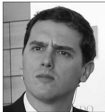
A. Rivera. E. P.

“Que Margallo ha ido por libre en este Gobierno desde el principio de la legislatura no es un secreto para nadie. Y que lo ha hecho presumiendo de su amistad con el presidente, tampoco”