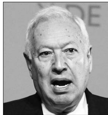
J. M. García-Margallo.

¿Podría sintonizar García-Margallo con un joven como Albert Rivera que, sin experiencia negociadora, pedirá el oro y el moro a un Gobierno del PP para apoyar la continuidad de Rajoy como presidente? Opiniones las hay para todos los gustos en el Ejecutivo y en Génova, 13. Es verdad que el ministro de Exteriores tiene en su cabeza la experiencia de lo que fue la UCD al comienzo de la Transición, pero también debe contarse con que los parámetros con los que trabaja una formación como Ciudadanos son otros muy distintos, instalados en una forma de comunicar más adosada a las redes sociales y menos a los conciliábulos de