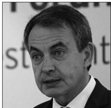
J. L. Rodríguez Zapatero.

Estos días se escuchan algunas críticas a Pedro Sánchez en su partido por no haber tenido reflejos suficientes y haber esperado a que fuera Rajoy quien iniciara la ronda de encuentros con los principales partidos, pese a que la iniciativa partió de Ferraz. Si hace dos meses, cuando las entrevistas con Albert Rivera , Pablo Iglesias , Josep Antoni Durán i Lleida , Andrés Herzog o Alberto Garzón todavía no estaban en la agenda de La Moncloa, el líder socialista hubiera tomado la decisión de hablar y fotografiarse con todos ellos, habría ganado muchos puntos a su favor, situando al presidente del Gobierno fuera de