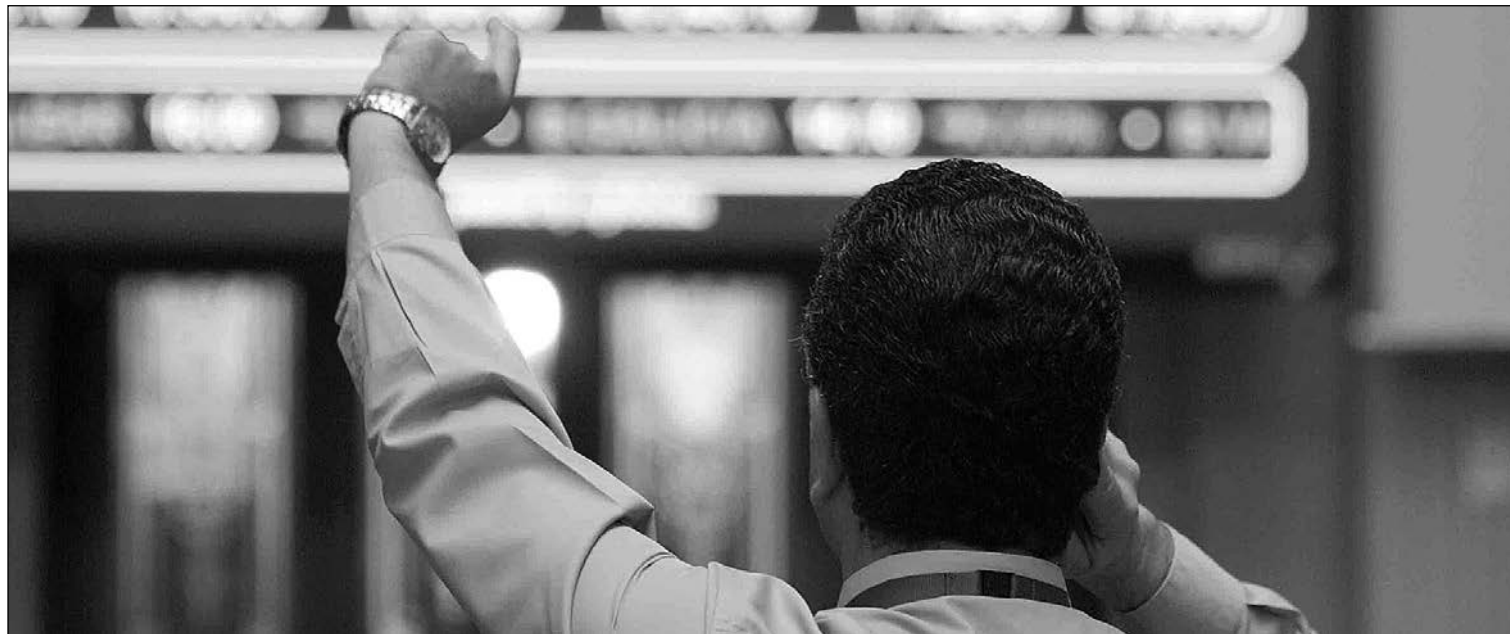
Bolsa de Madrid.

06-11-15 *En el mercado de materias primas