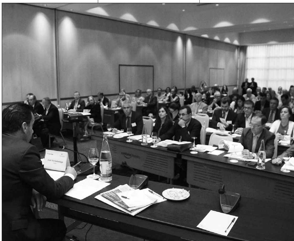
El público asistente escuchó atentamente las intervenciones de los expertos.

Tras estas referencias históricas, la experta habló del delito de contrabando de tabaco que, según estimaciones, hace perder anualmente a los presupuestos tanto de los Estados miembros como de la Unión Europea, 10.000 millones de euros. "Es importante tener en cuenta que este delito tiene además un grave impacto tanto en el sector público como en el sector