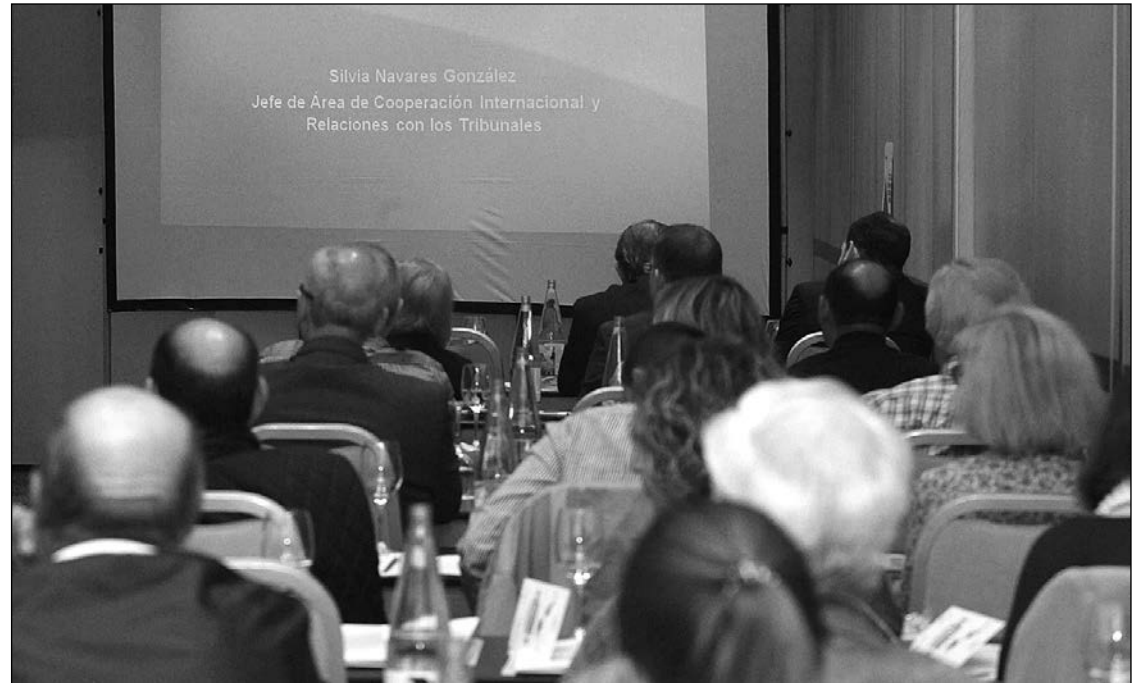
Los asistentes a la Jornada siguieron atentamente las presentaciones de los ponentes.