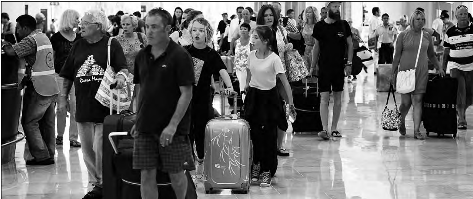
En el primer semestre del año, España ha recibido 29,2 millones de turistas.

El dinamismo del turismo no deja dudas. En el primer semestre, España ha recibido 29,2 millones de visitantes internacionales, un 4,2% más. Hablamos de un sector al que se califica como el gran salvavidas de la economía española, incluso en los peores tiempos. Su tirón se ha mante-