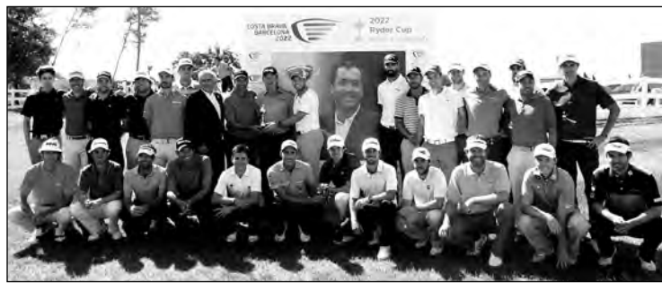
Todos los jugadores españoles en el Open de El Prat con la imagen de Seve Ballesteros.

Severiano Ballesteros , gran icono del golf español, y de la Candidatura Costa Brava – Barcelona 2022 para la organización de la Ryder Cup, constituyen dos motivaciones extra para la amplia y cualificada nómina de jugadores españoles presentes en el Open de España 2015, que acogió el RCG El Prat, entre el 14 y el 17 de mayo, con el patrocinio principal de Reale Seguros . Pasado, presente y futuro se dieron cita en el célebre recorrido barcelonés, donde hace cuatro años, durante la celebración el Open de España de 2011, se dio a conocer el fallecimiento de Severiano Ballesteros, recordado ahora mediante una fotografía de gran tamaño que sirve de guía para el numeroso grupo de jugadores españoles que buscan la victoria.