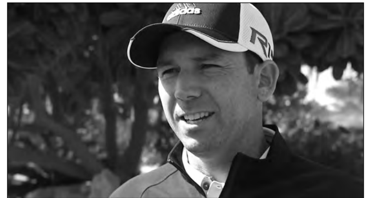
Sergio García terminó segundo en uno de sus torneos favoritos.

Este año el desempate se desarrollaría de producirse con un nuevo "minitorneo" de tres hoyos en el que los tres jugadores protagonistas jugaría el 16, el 17 y el 18 suman-