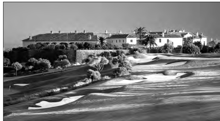
Finca Cortesín, uno de los mejores campos de España en The Gecko Pro Tour.

Finca Cortesín es uno de los resorts más importantes al sur de Europa, epicentro de un turismo de