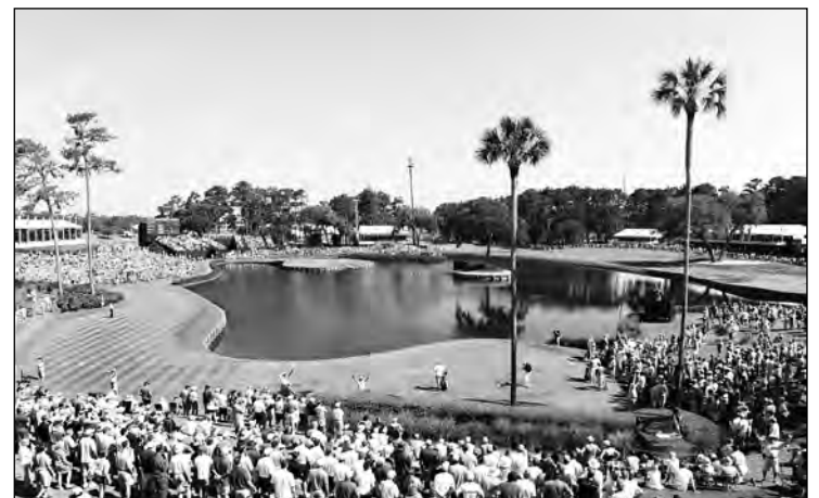
El TPC de Sawgrass, un lugar espectacular para el que llaman "quinto grande".

do sus resultados. En caso de persistir el empate se jugarían de nuevo y ya con formato de muerte súbita el 17, el 18 y el 16. Tras los primeros tres hoyos jugados fue Sergio García el que cayó al no hacer birdie al 17.