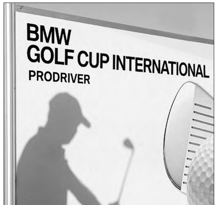
El circuito BMW arrancó en La Galiana.

E l club de golf La Galiana acogió el pasado sábado la primera prueba clasificatoria de la BMW Golf Cup International patrocinada por el concesionario oficial BMW Pro-driver. Desde primera hora de la mañana, más de un centenar de jugadores se dieron cita el club valenciano para disfrutar de una gran fiesta del golf en la que la diversión y el excelente tiempo fueron los protagonistas. P4