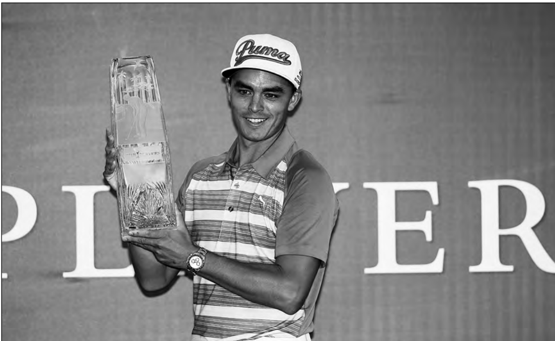
Rickie Fowler, ganador en el TPC de Sawgrass.