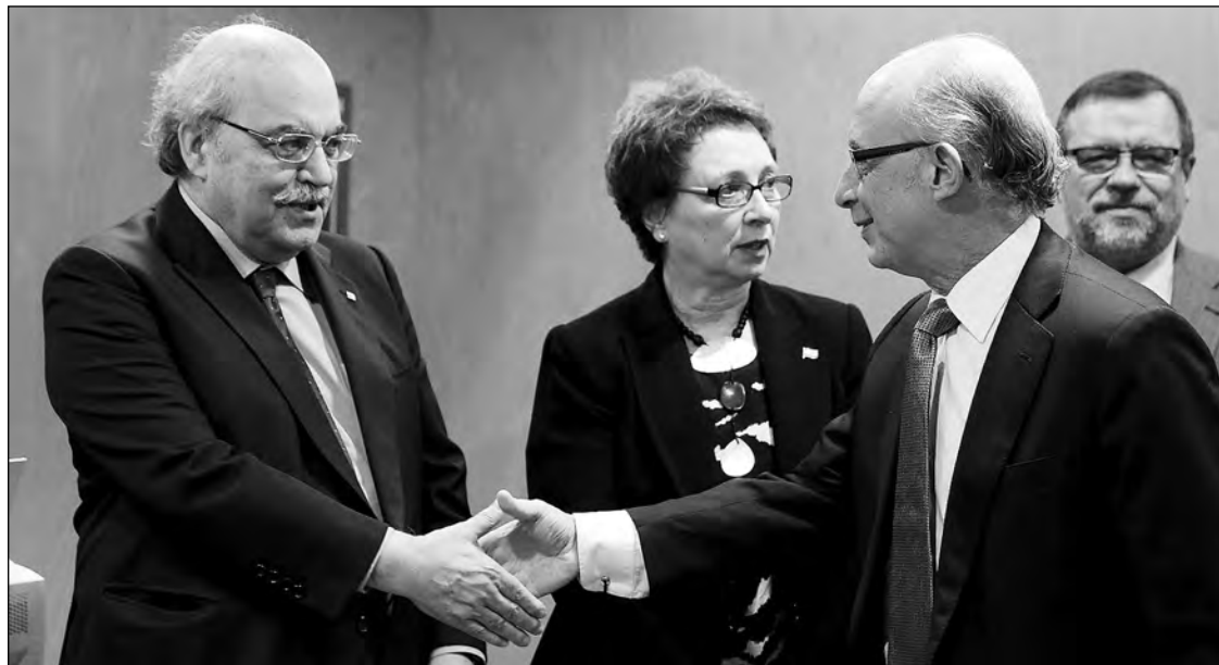
Cristóbal Montoro y Andreu Mas-Colell se saludan durante un Consejo de Política Fiscal y Financiera.

Y es que, el nuevo método de cálculo que ha colgado en su web el Ministerio, no convence.