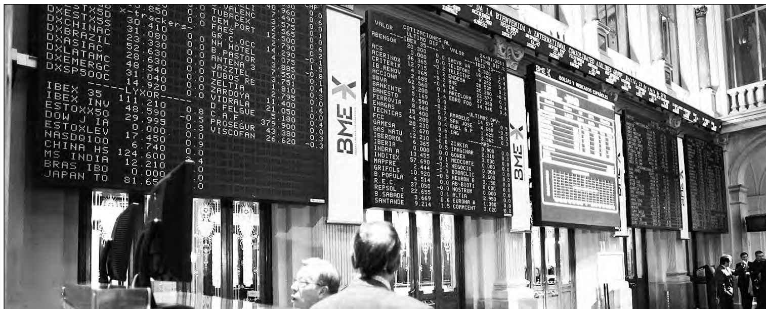
Bolsa de Madrid.

BME ha pagado cuatro dividendos en 2013 y se coloca en lo más alto del Ibex-35 por retribución al accionista. La suma de estos cuatro repartos eleva la remuneración al accionista a lo largo de todo el ejercicio hasta 1,742 euros brutos por acción y sitúa la rentabilidad por dividendo de la compañía en el 6,2%. Además, la Bolsa espa-