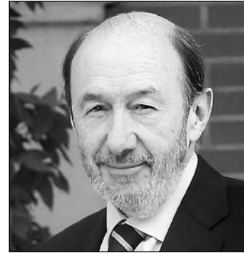
A. Pérez Rubalcaba.