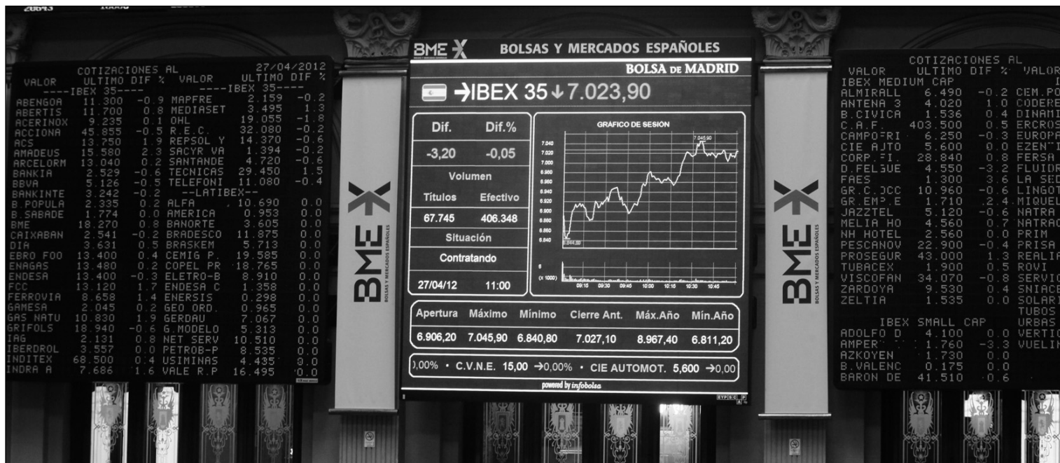
Bolsa de Madrid.

El sector financiero ha dejado de ser el gran fantasma de la Bolsa española –los bancos representan cerca del 37% del peso del Ibx– para convertirse en su gran motor. BBVA, Bankinter y Bankia ya valen más que el teórico valor de sus activos. En concreto, los seis que cotizan en el Ibx-35 se han disparado más del 40% desde sus