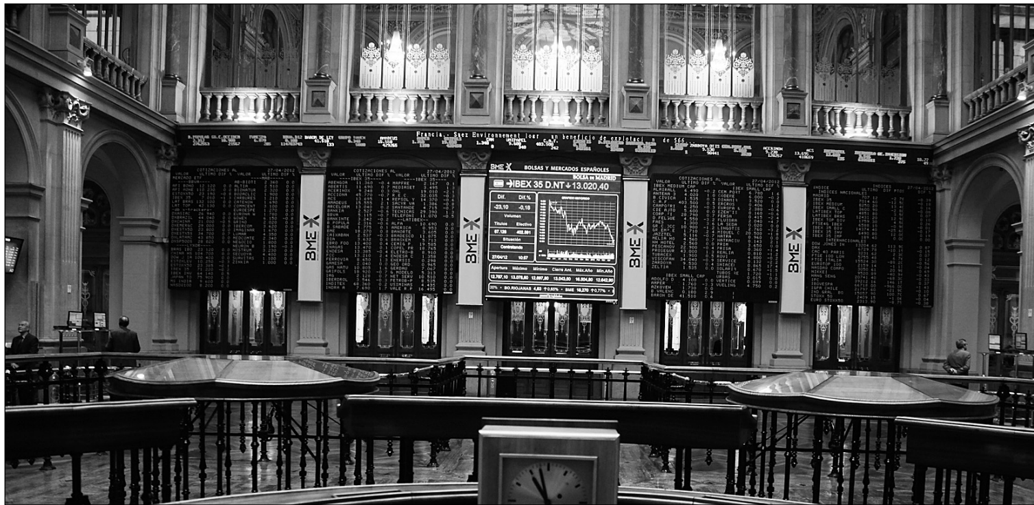
Bolsa de Madrid.

05-03-13 *En el mercado de materias primas