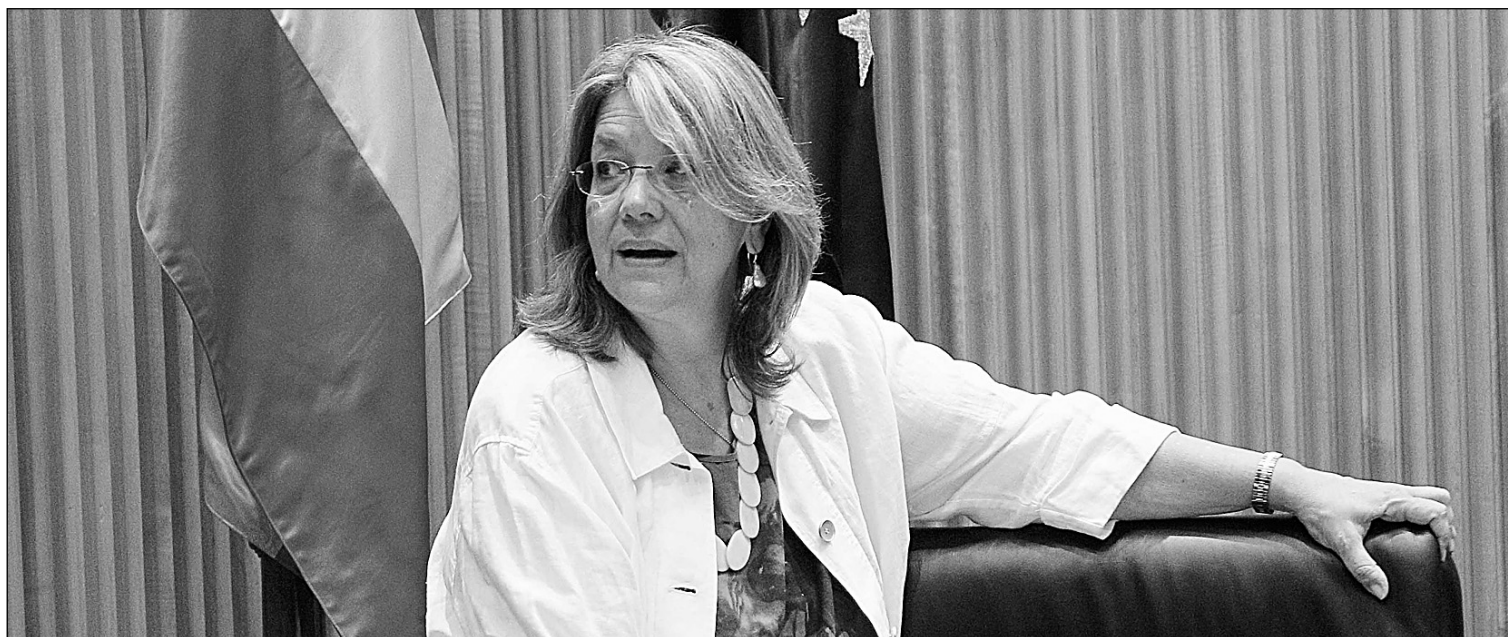
Elvira Rodríguez, presidenta de la Comisión Nacional del Mercado de Valores (CNMV).