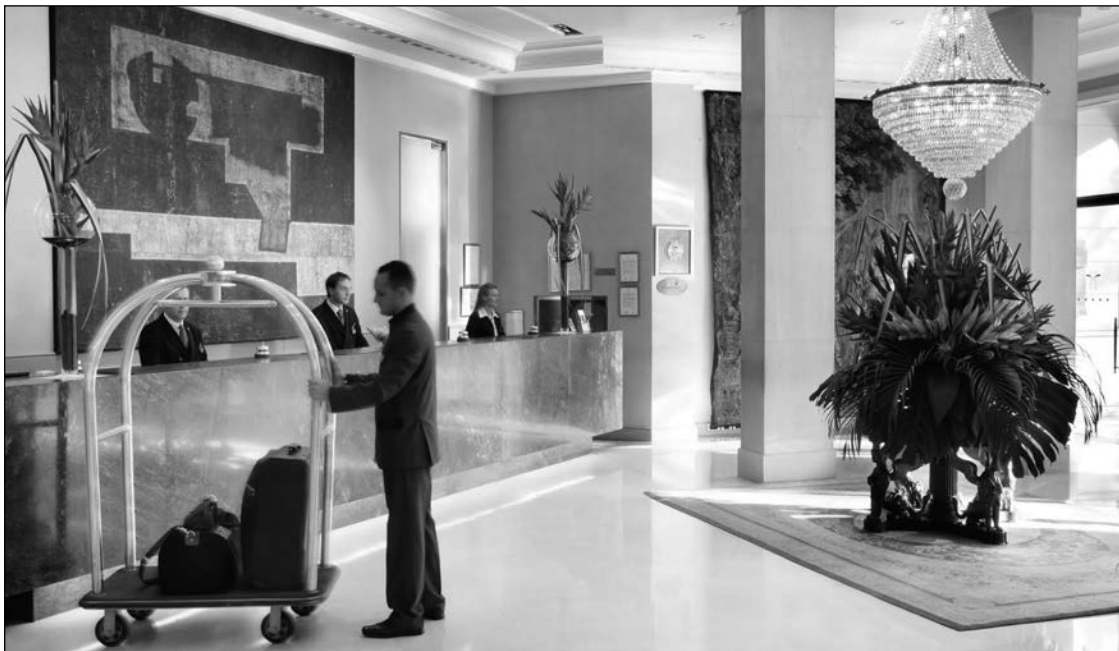
El leve repunte de la contratación, de cara a la Semana Santa, es un síntoma evidente de estancamiento.