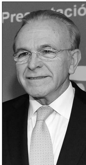
Isidro Fainé , presidente de Caixabank.

La retribución de los banqueros sigue siendo la más alta del panorama empresarial español, pero incluso este colectivo ha visto rebajar su sueldo por los malos resultados de las entidades. El presidente y el consejero delegado del Banco Santander percibieron en 2012 salarios un 32% y un 29% menores a los obtenidos un año antes.