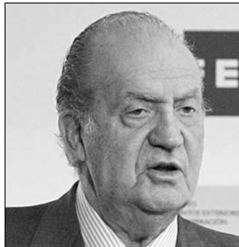
El rey Juan Carlos.

el líder del PSOE a través de los ciudadanos que buscan comida en los cubos de basura o los jubilados que no se medican para dar de comer a su familia. En el PP se respira aire fresco después del debate de la nación porque han visto a Mariano Rajoy muy crecido, en un momento en el que muchos intuían que atravesaba un bache difícil por el 'caso Bárceñas ' y acariciaba, incluso, una remodelación de Gobierno con los ministros Montoro , Wert , Mato y Báñez en primer tiempo de salud. En el entorno del presidente se comenta que una respuesta así no hubiera sido lógica en él, extremadamente reacio a actuar bajo presión de los medios de comunicación y, mucho menos, del PSOE. Y es que, pese a las dificultades del momento, Rajoy empieza a estar convencido de que su Gobierno ha puesto ya los cimientos para levantar la recuperación y de