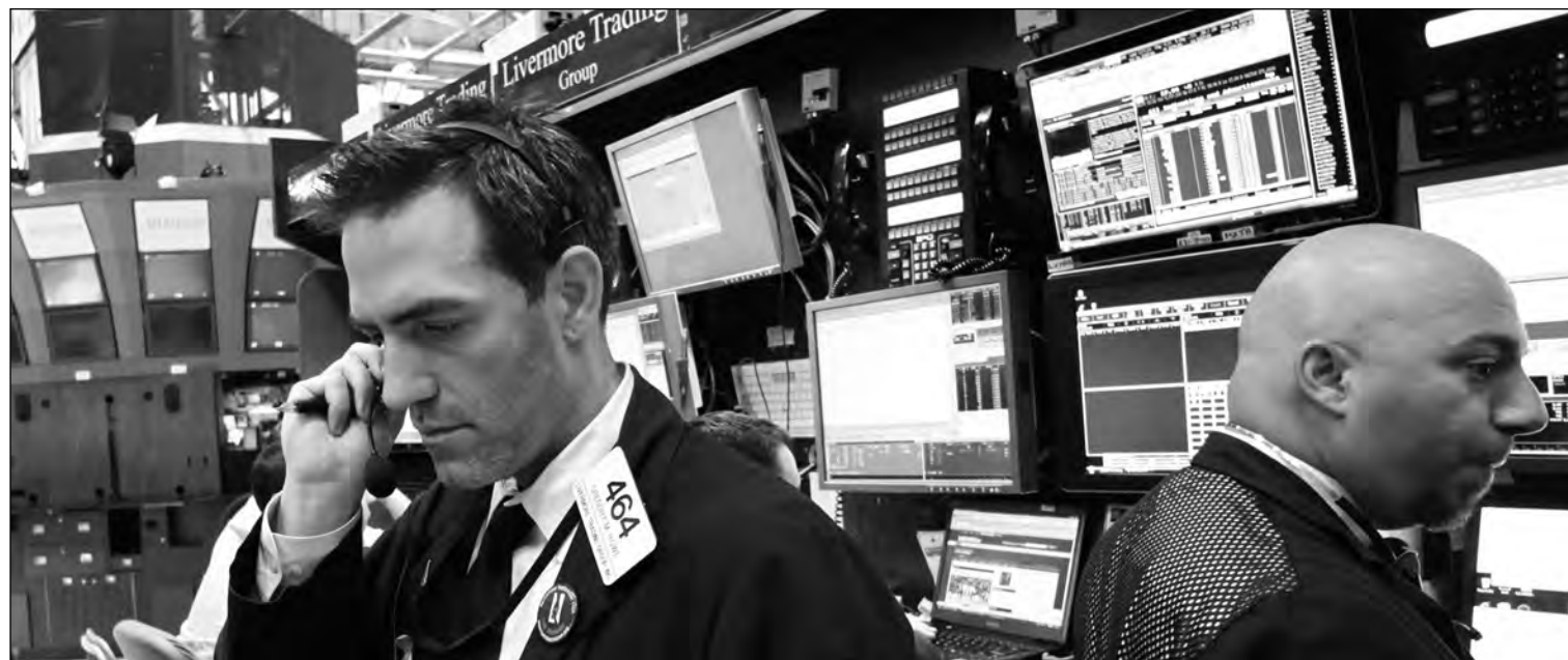
Bolsa de Fráncfort.

08-11-12 En el mercado de materias primas