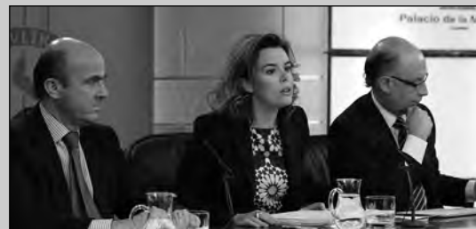
L. de Guindos, S. Sáenz de Santamaría y C. Montoro.

Eso sí, la norma del Gobierno hará incompatible el cobro de esa indemnización de exalto cargo con cualquier otro sueldo, una medida que podría afectar a varios miembros del gabinete de Zapatero como Alfredo Pérez Rubalcaba, José Blanco, Francisco Caamaño, Antonio Camacho, Trinidad Jiménez, Valeriano Gómez, Ramón Jáuregui o Manuel Chaves.