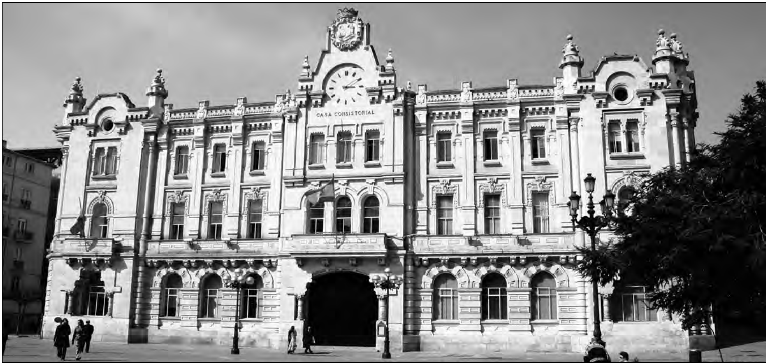
Bruselas supervisará los planes de ajuste que han presentado los ayuntamientos para poder acogerse al Plan de Proveedores.

Los cargos municipales no han estado dispuestos a renunciar a la mayor parte de su estructura actual, pese a que su sobredimensionamiento ha llevado a la mayoría de los consistorios a la situación de casi quiebra técnica. Los