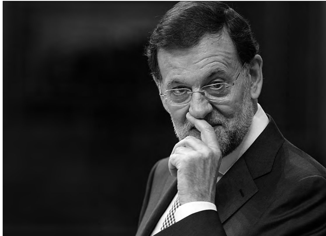
Mariano Rajoy durante su comparecencia en el Congreso.

Tras las decisiones políticas de Bruselas tendentes a la construcción