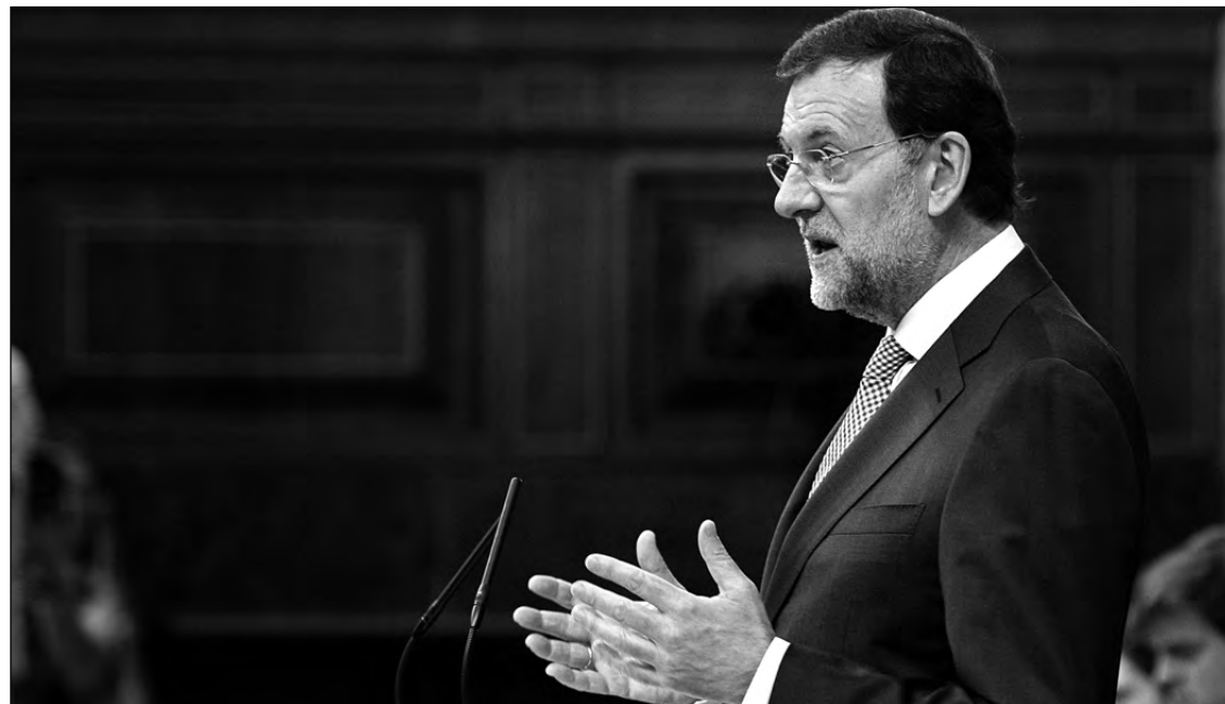
El presidente del Gobierno, Mariano Rajoy, anuncia en el Congreso los nuevos recortes para ahorrar 65.000 millones.

Además, el país será vigilado de cerca. Inspectores de la Unión Europea y del Fondo Monetario Internacional (FMI) viajarán a España cada tres meses para vigilar que Madrid cumple sus obligaciones en el sector financiero, pero, también, en cuanto a la consolidación fiscal y las reformas estructurales. Asimismo, el rescate bancario establece que las entidades financieras españolas que reciban ayudas deberán detallar su plan de reestructuración. También verán limitados los dividendos, serán obligadas a realizar despidos y a limitar la remuneración de los directivos. Luis De Guindos , ministro español de Economía y de Competitividad, ha afirmado que el conjunto del sector tendrá que acatar ciertas imposiciones. En este sentido, ha detallado que