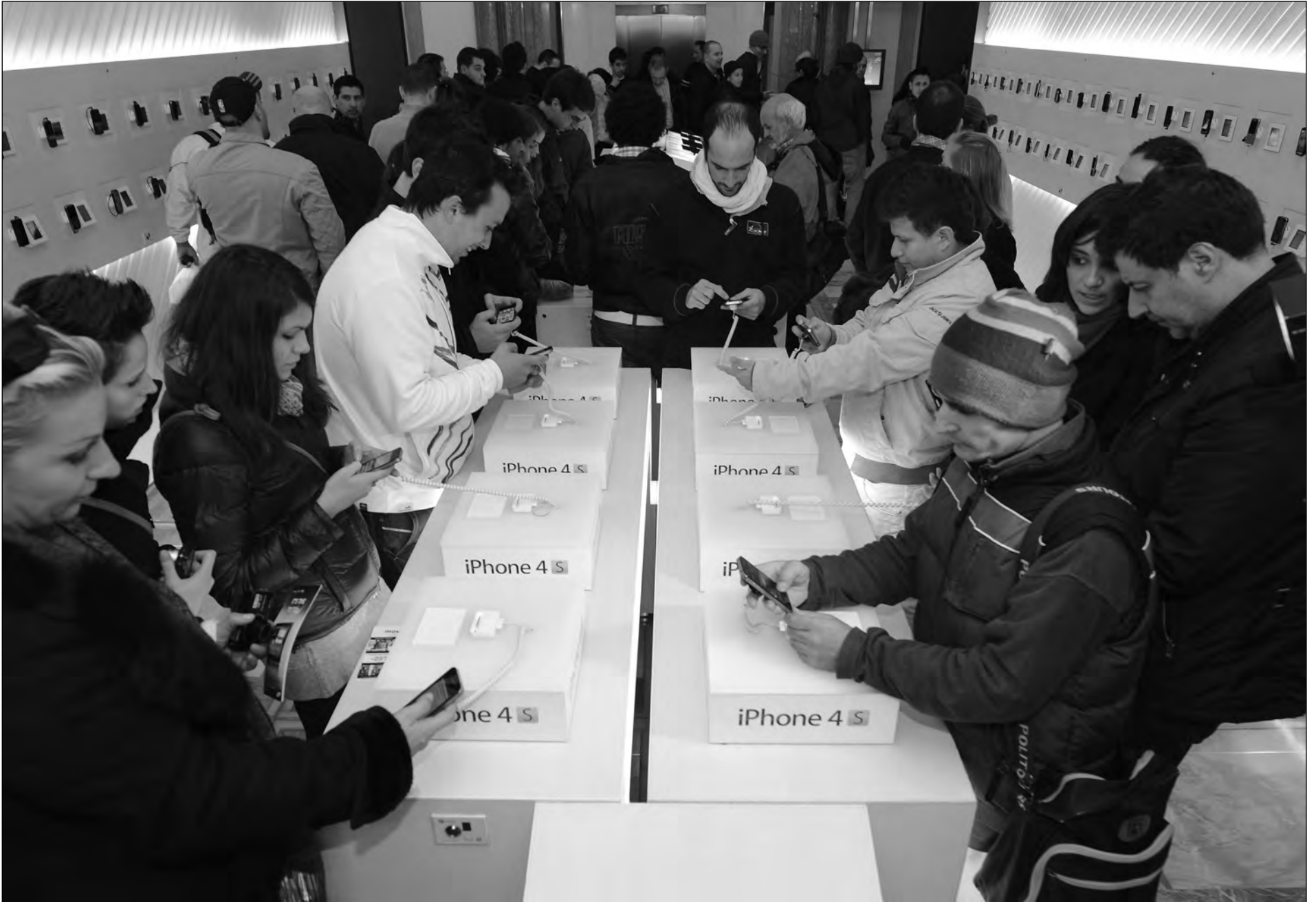
Acercarse a las necesidades y posibilidades del consumidor ha dado lugar un año en el que el cliente se ha convertido en el rey de las ofertas.

El sector de las telecomunicaciones ha vivido un 2011 movido en lo que a competencia se refiere. La crisis del consumo y la agresividad de los nuevos operadores han llevado a todas las compañías a esforzarse por retomar el contacto más personalizado con el cliente y colocarlo en el centro de su estrategia. Telefónica en el último semestre ha encadenado una batería de ofertas para consolidar su liderazgo: nuevas tarifas de prepago para que sus usuarios