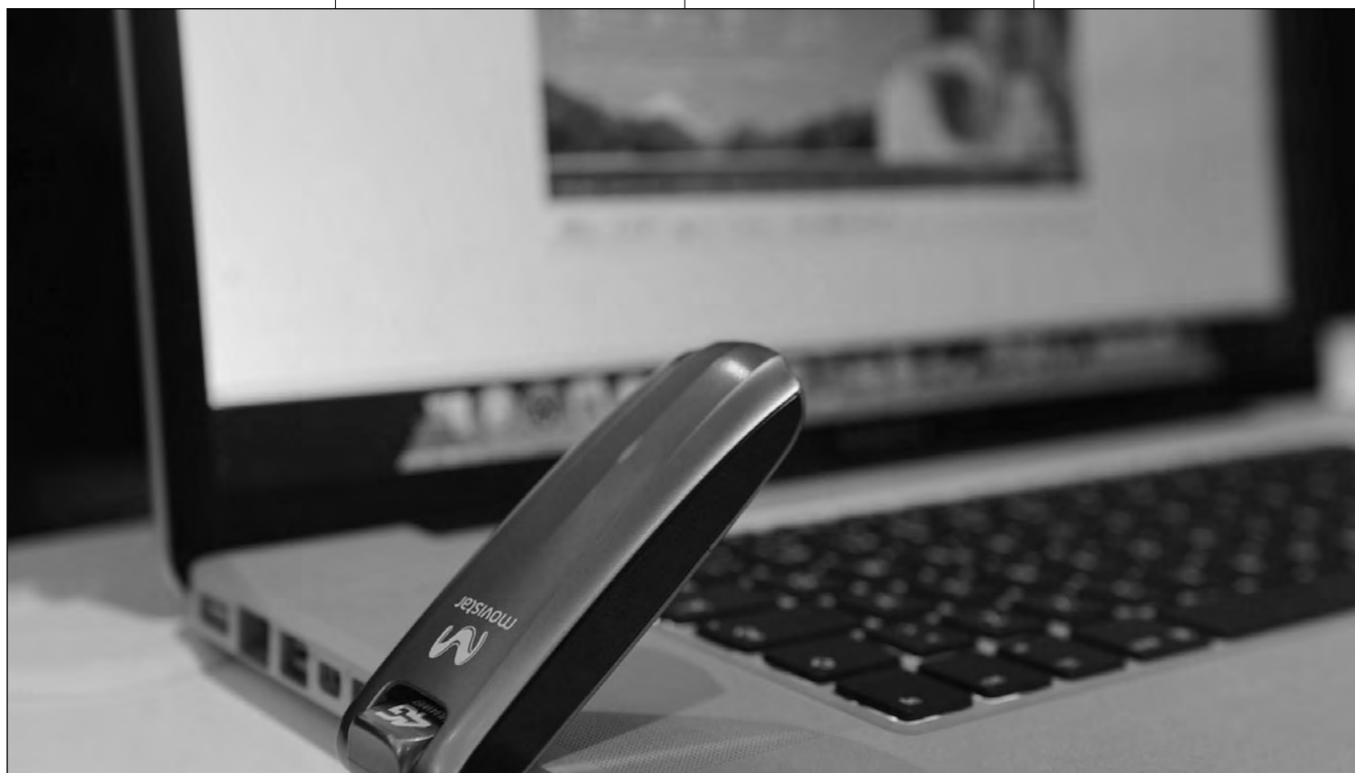
Telefónica continuará desplegando progresivamente los servicios 4G a todos los segmentos de mercado.

de considerar al cliente el centro de sus operaciones con nuevos lanzamientos en otros segmentos y áreas de negocio.