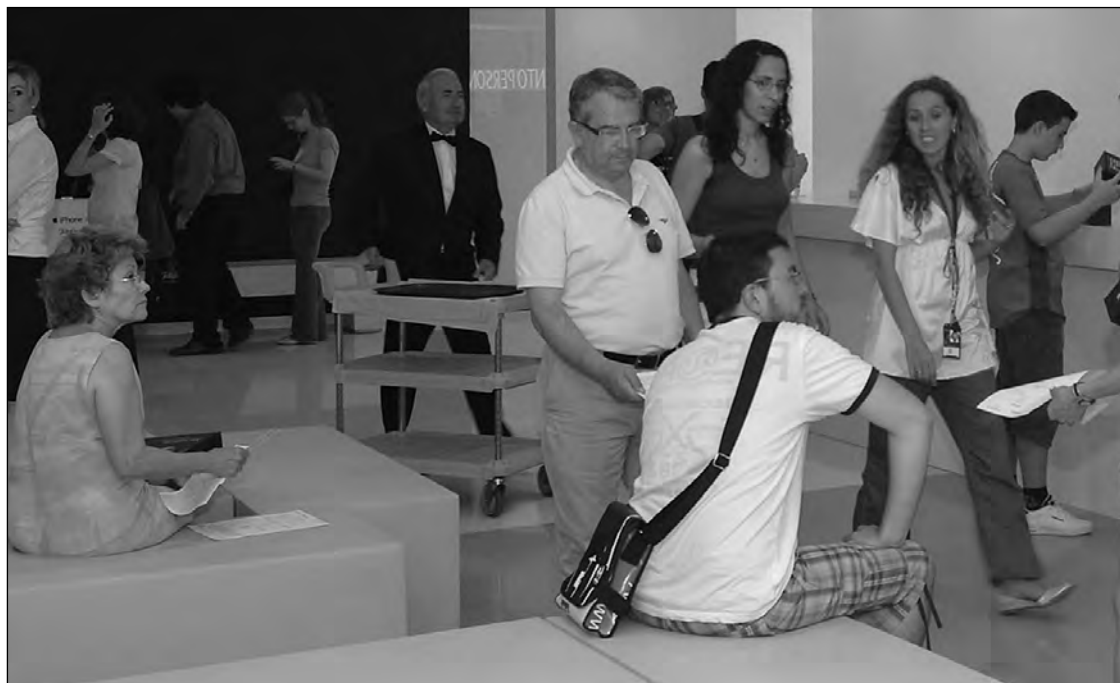
La pelea por conseguir clientes y fidelizarlos continuará en 2012.