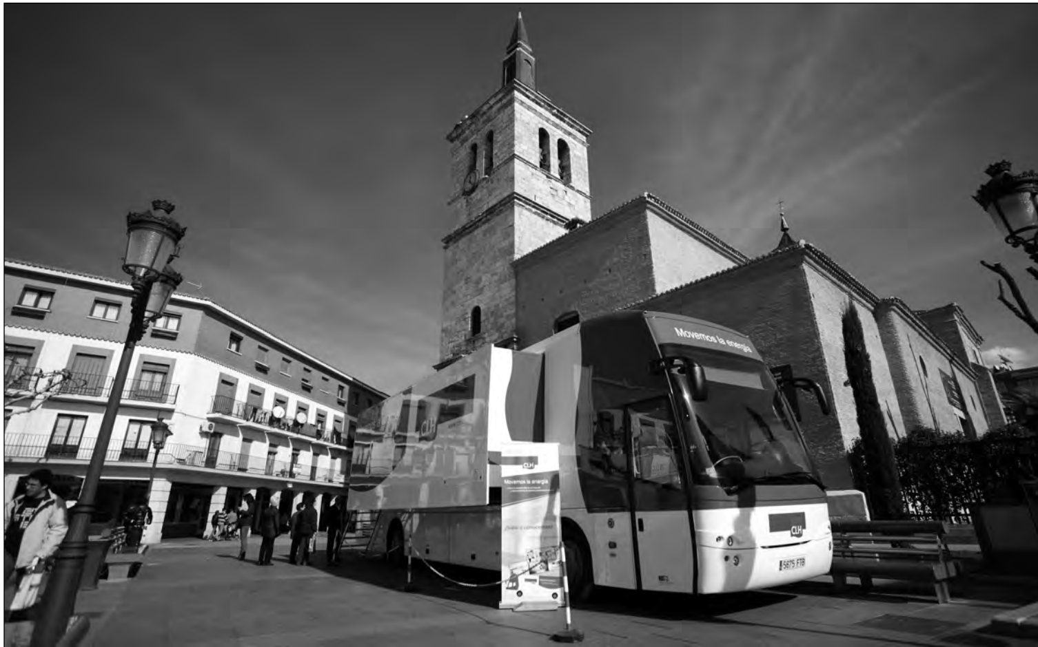
A lo largo de tres meses, la muestra 'Movemos la energía' recibió más de 9.000 visitas y recorrió 27 municipios.

E l Grupo CLH puso en marcha a finales de 2010 la exposición itinerante "Movemos la energía", con la finalidad de que los ciudadanos conocieran mejor la función logística que realiza la compañía y comprendieran de forma sencilla cómo llegan los combustibles a sus coches y a sus hogares.