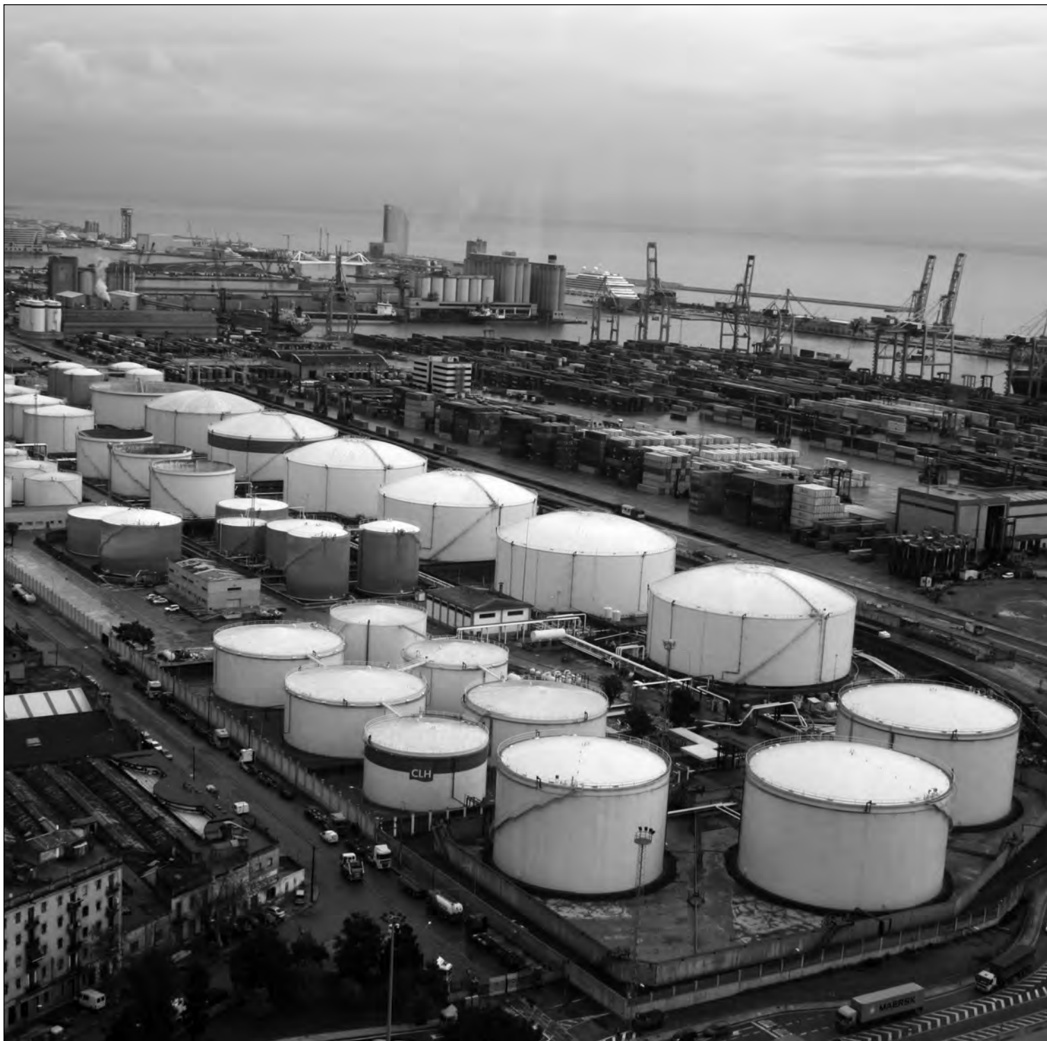
El puerto de Barcelona estrenó seis nuevos depósitos de almacenamiento y un nuevo muelle.