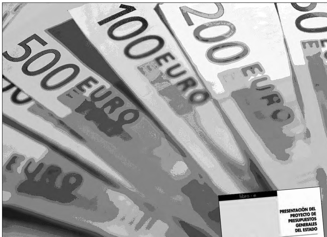
Los Presupuestos deben comprometer el ajuste pactado con Bruselas.

Hay que recordar que los dos principales candidatos de PP y PSOE se comprometieron a respetar de principio a fin los compromisos contraídos con Bruselas de cerrar el año 2012 con un déficit público del 4,4% del PIB. A bote pronto, esto significa un ahorro de 17.500 millones de euros, cantidad que es susceptible de crecer si el Gobierno actualmente en funciones no consigue reconducir el déficit hasta el 6%. "Estaríamos hablando de unos 30.000 millones de euros, el doble del tijeretazo aplicado por José Luis Rodríguez Zapatero en mayo de 2010, cuando