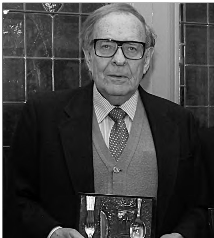
Ramón Tamames, economista, recoge la placa Bachiller en Fogones, de El Nuevo Lunes