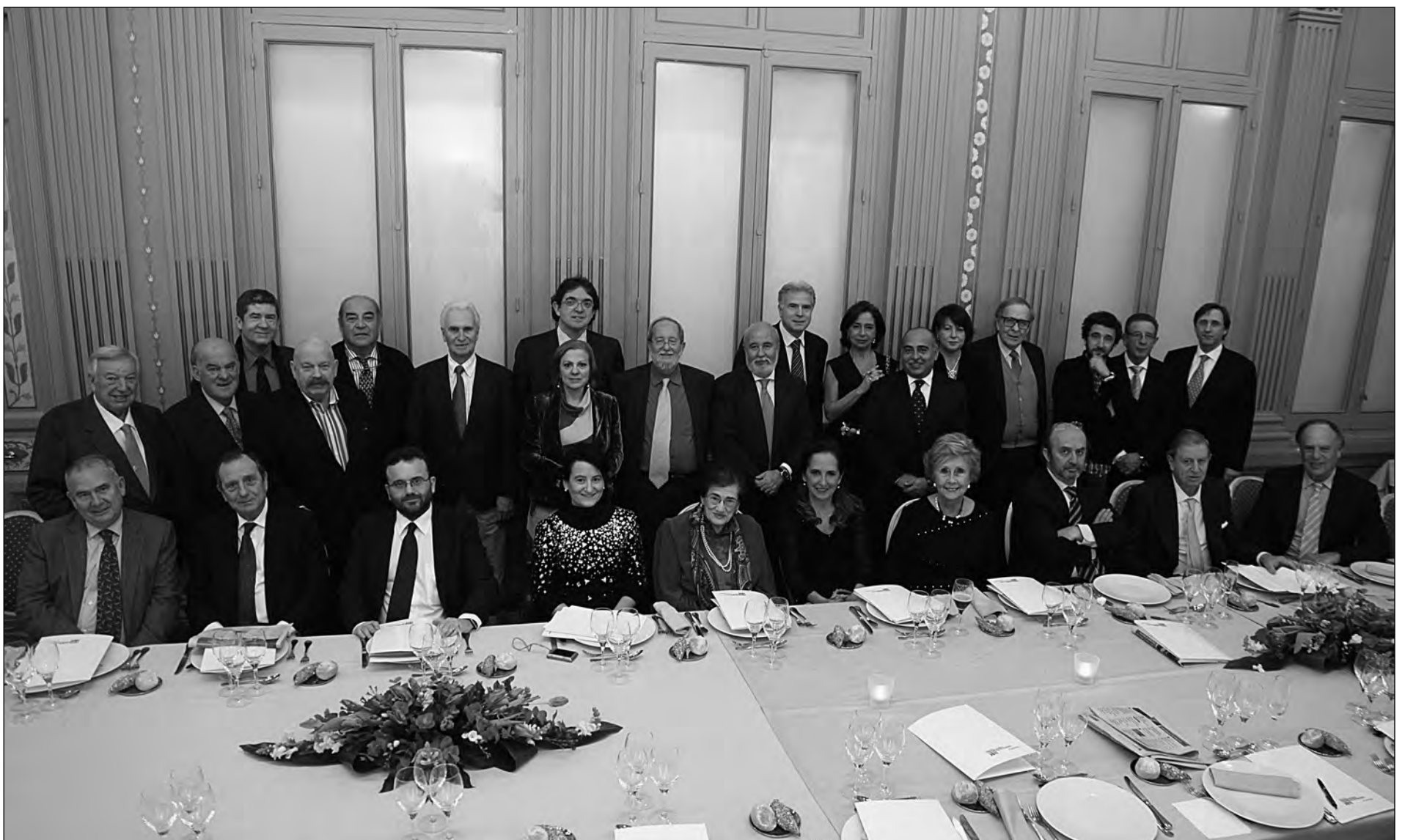
El jurado que ha elegido los trofeos y placas de La Gula y Bachiller en Fogones de EL NUEVO LUNES para la XXIX edición del año 2012, compuesto por periodistas y miembros de la Cátedra de La Gula y Bachiller en Fogones de EL NUEVO LUNES.

Nota.- El Jurado lo forman los premiados de todas las ediciones anteriores más los representantes periodísticos de la información gastronómica y económica.