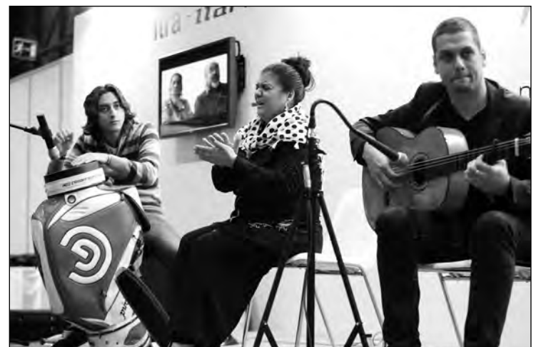
La Feria fue una vez más centro de reunión del golf español y filtro de nuevas iniciativas para este deporte.