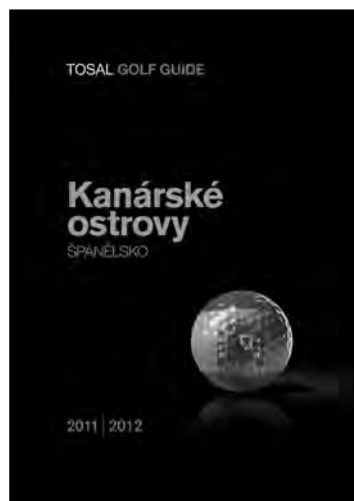
Portada de la guía.

La iniciativa es producto de la investigación y el estudio de numerosos análisis del máximo prestigio internacional, nacional (IAGTO, European Golf Association, THR y Turespaña) y especialmente de aquellos realizados por la empresa sobre el terreno, además de los realizados por las administraciones canarias y sus universidades. Del conocimiento