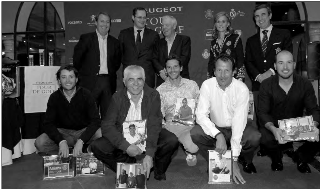
Los mejores profesionales españoles estuvieron presentes.