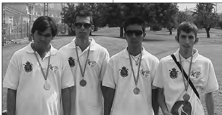
Los chavales del Real Club de Golf de Sevilla, todo un ejemplo de superación.

Sin duda, el mejor premio para esta labor docente deportiva desarrollada en el Real Club de Golf ahora premiada por la Delegación de la Consejería de Comercio, Turismo y Deporte de Sevilla.