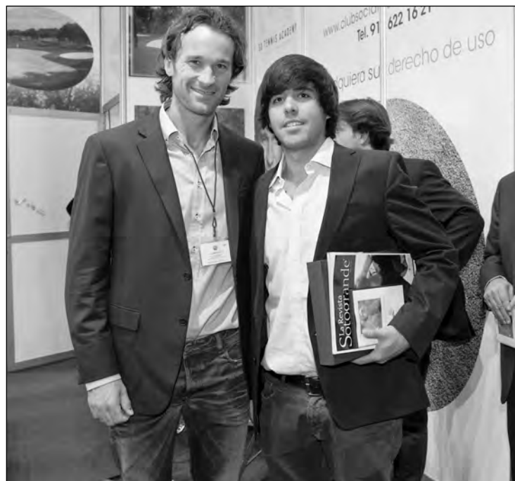
Carlos Moyá y Javier Ballesteros, dos de los ilustres visitantes de la Feria.

El éxito cosechado por madridGOLF este año también se ha visto reflejado en la participación e implicación de todos los visitantes en las actividades de ocio y entretenimiento organizadas por los expositores. Consecuentes con el lema del encuentro, "Descubre un universo de golf", la Real Federación Española de Golf ha ofrecido "Bautismos de Golf" a los que han querido iniciarse en este deporte y el Putting-Green ha sido una de las zonas más concurridas del certamen, al igual que las pruebas de putt y preguntas sobre Severiano Ballesteros de la mano de Mercedes Benz. También la Zona de Juego Corto de Reale ha obtenido gran número de participantes en sus concursos, así como el siempre abarrotado Hoyo 19 -el bar de la feria- patrocinado por Osborne y Cinco Jotas.