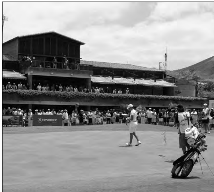
Golf Las Américas, de nuevo premiado por Deporte and Business.

■ Golf Las Américas , en el sur de Tenerife, ha vuelto a ser nombrado por Deporte & Business como el mejor campo de España para organizar torneos. Este galardón, que se le ha resistido en los dos últimos años (La Reserva de Sotogrande y La Sella Golf fueron los ganadores en las dos últimas ediciones), ya lo había conseguido en tres ocasiones (2006, 2007 y 2008). El premio es entregado por Deporte & Business al final de cada temporada al club de golf que mejor cumple con sus funciones, más implicación tiene con los torneos, mejor trato dispensa a los patrocinadores, y en definitiva, más a gusto nos hace sentir a todos los que acudimos a los torneos.