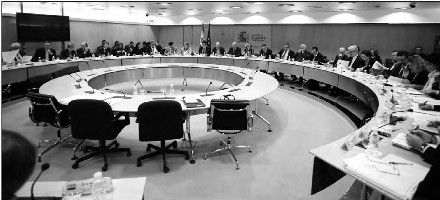
Las comunidades en las que gobierna el PP se quejan de falta de información sobre las estimaciones de ingresos reales.

En circunstancias normales y, en pleno otoño, las comunidades autónomas habrían presentado ya su proyecto de cuentas públicas para 2012. La explicación que ofrecen los Ejecutivos populares para justificar este aplazamiento es que Elena Salgado no les ha facilitado todos los datos sobre