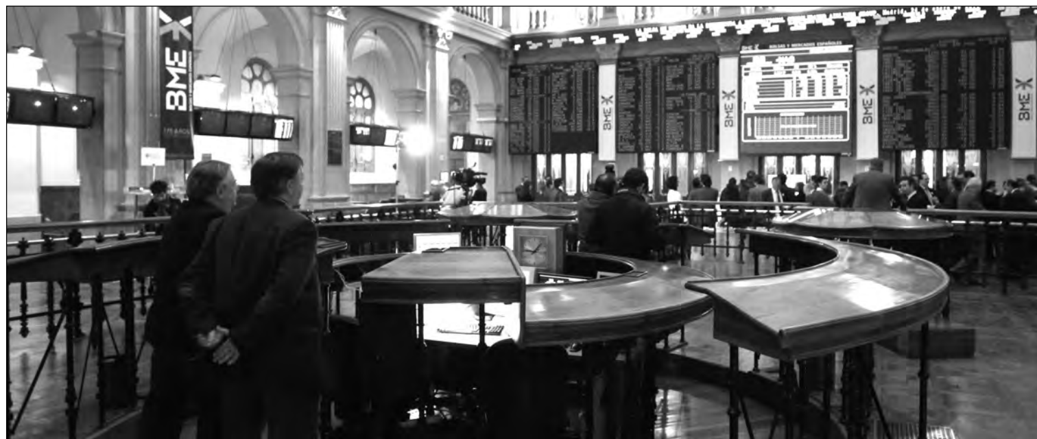
La Bolsa de Madrid refleja la caída de valoración bursátil de los grandes bancos españoles.

Datos del 21/10/10 al 21/10/11 * En el mercado doméstico y nacional